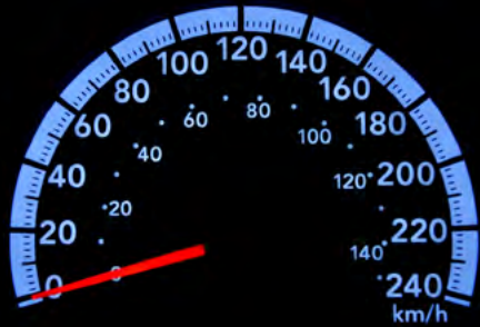
Tableau de bord de l'entreprise